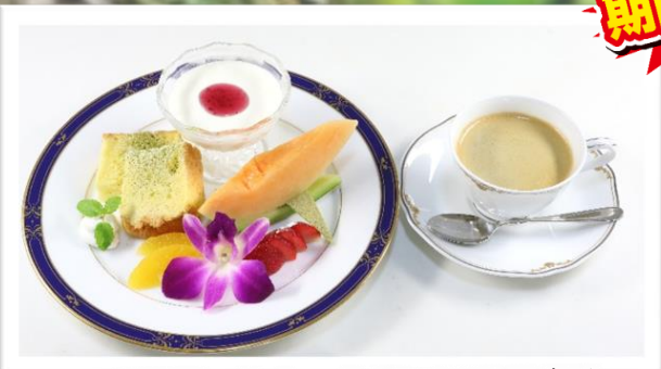
デザートセット(1ソフトD付) 1,100円