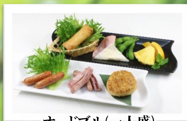
オードブル(一人盛) 1,100円