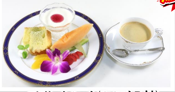
デザートセット(1ソフトD付) 1,100円