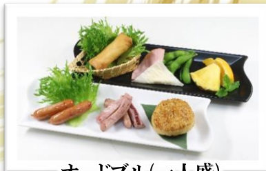
オードブル(一人盛) 1,100円